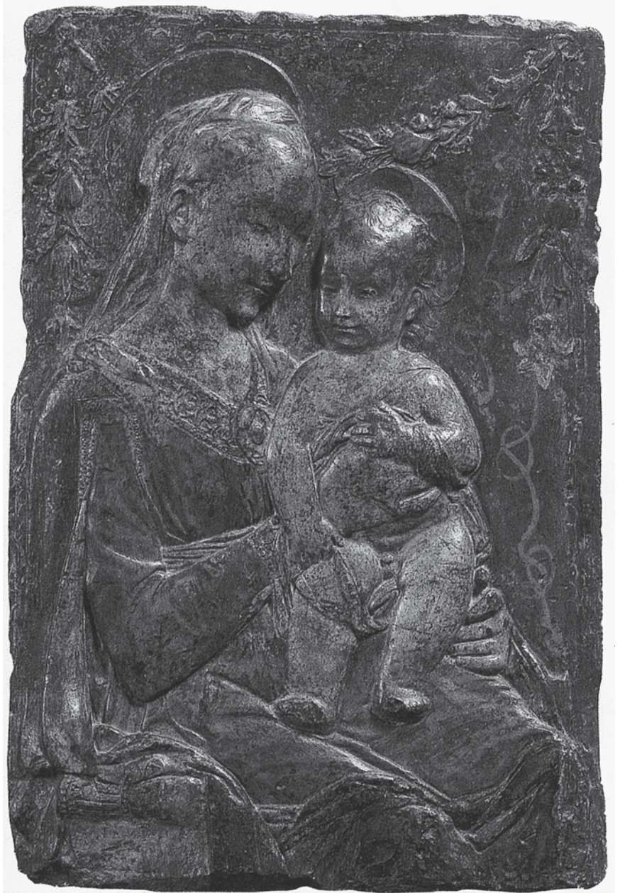
Madonna di San Benedetto: prototipo della Madonna dell'Ermitage di Antonio Rossellino (1427-1479) in terracotta da cui è tratto il bassorilievo del Museo di San Benedetto, ora in restauro a cura della nostra Società

Altri esemplari, alcuni marmorei, sono custoditi nei musei del